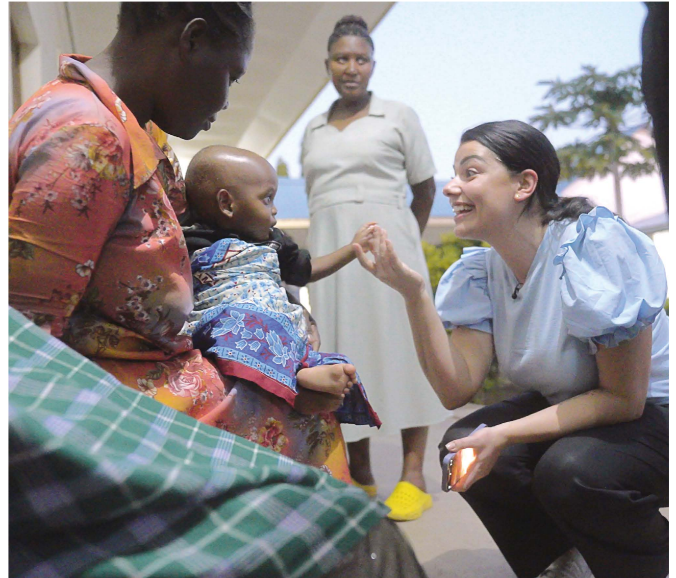
Mammorna som kommer till Nkinga får alla information om preventivmedel och sjukvården följer även upp föräldrarna på ett annat sätt nu jämfört med tidigare. Det finns även en mödravårdsavdelning för gravida, och en avdelning för att vaccinera, väga och mäta barnen. Allt för att bädda för en god framtid även för barnen.

"Jag var beredd på att det kunde bli en svår resa, och det blev det."