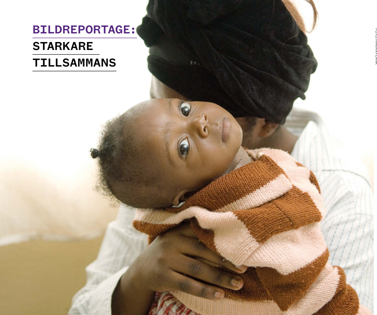
Ingen tryggare plats än i sin mors famn.